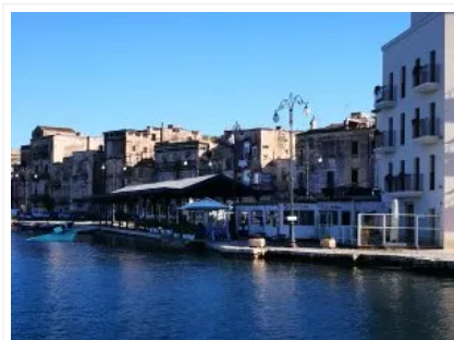
Taranto, città vecchia dal mare (foto la Ringhiera)

Sul mare, ad esempio, c'è un grande fermento: la festa della Marina Militare a giugno, il Palio di Taranto, Taranto Port Days, la rinata Fiera del Mare, la rassegna Due Mari di libri, la prossima inaugurazione di Ketos il centro studi della Jonian Dolphin Conservation. Senza dimenticare il costante e prezioso lavoro di ricerca dell'ex Istituto Talassografico e i tanti operatori che rientrano a pieno titolo nella cosiddetta blue economy. Anche i Giochi del Mediterraneo