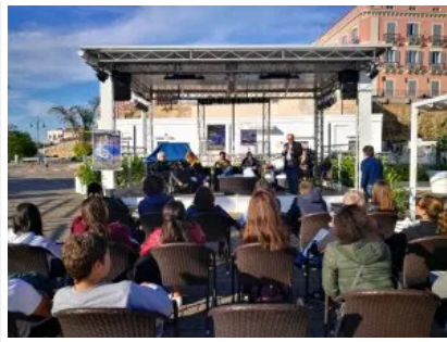
Corto2Mari, Aspettando il Festiva