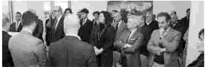
Nei giorni scorsi l'inaugurazione della nuova sede di Confapi Taranto, in via D'Aquino 28

TARANTO - È stata inaugurata nei giorni scorsi la nuova sede di Confapi Taranto. I nuovi locali della confederazione italiana delle piccole e medie imprese private, trovano spazio nel cuore di Taranto, ovvero in via D'Aquino, 28.